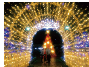
フォトコンテスト金賞作品