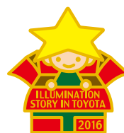
2016年の ピンバッジデザイン